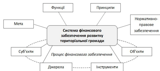
Рис. 1. Елементи системи фінансового забезпечення розвитку територіальних громад (розробка автора)

Зазначені вище структурні компоненти системи ФЗРТГ можна зобразити у вигляді схеми (рис. 1).