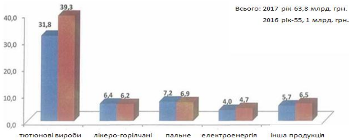
Рис. 1. Динаміка надходжень акцизного податку на відповідні види товарів у 2016 та 2017 роках

підакцизних товарів у 2017 році, порівняно з 2016 роком, відбулося за рахунок реалізації тютюнових виробів (7,5 млрд. грн.), а з урахуванням того, що з 01.01.2017 були збільшені ставки акцизного податку на 40 %, обсяги з реалізації тютюнових виробів в Україні скоротилися на 10,6 % (у 2017 році мінімальна ставка акцизу на 1000 сигарет становила: в Україні складала 20 євро, а в ЄС 90 євро). Зокрема, у світовій практиці акцизний податок, і на сьогодні, є одним із основних бюджетоутворюючих податків та інструментом держави для скорочення чисельності споживачів тютюнових виробів.