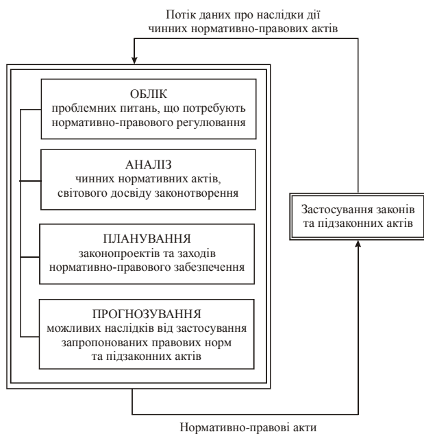
Рис. 2. Основні етапи опрацювання потоків інформації

В системі політичної комунікації важливе місце посідає аналіз зв'язків різних шарів інформації, що зазнають трансформації в процесі основних складових її опрацювання в режимі «облік» – «аналіз» – «планування» – «прогнозування» (див. рис. 2) [8].