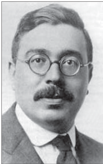
Норберт Вінер (1894–1964)

ча її відбувається не тільки безпосередньо від особи до особи при розмноженні [24]), не може давати еволюційний ефект без добору. Передусім тому, що будь-яка передача інформації не позбавлена шуму, помилок. Добір не має жодних «завдань» — ані абсолютного захисту переданої інформації, в тому числі генетичної, ані безумовного закріплення нового, «прогресивного». Добір формує системи, які, використовуючи структури і функціональний «досвід» минулого, здатні існувати в сьогоденні, нічого «не знаючи» про майбутнє.