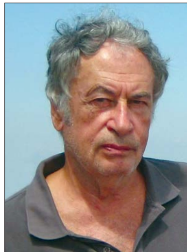
Валентин Абрамович Красилов (1937—2015)

Що ж стосується можливого зниження температури, рівень якої пов'язують з викидами так званих парникових газів, передусім діокси-