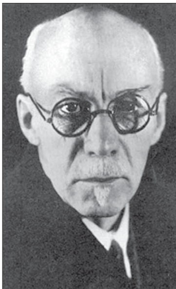
Іван Іванович Шмальгаузен (1884–1963)

інформації. Саме тому він є універсальним еволюційним фактором, а не просто редукує систему з двох (або більшого числа) елементів до одного.