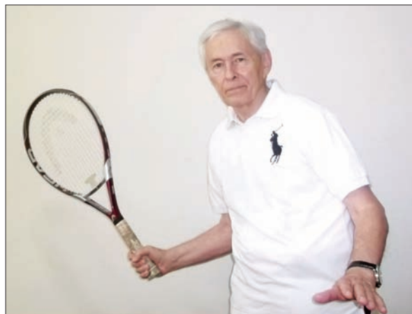
Рух — це життя