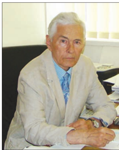
Едуард Віталійович Луговської

Сергій Васильович — академік НАН України, академік-секретар Відділення біохімії, фізіології і молекулярної біології НАН України, директор Інституту біохімії ім. О.В. Палладіна НАН України