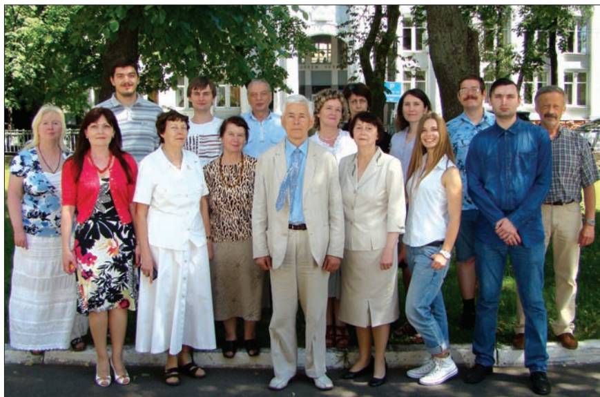
Відділ структури і функції білка Інституту біохімії ім. О.В. Палладіна НАН України

юся за ступенем активації фібриногену тромбіном. Е.В. Луговської розробив також оригінальну методику отримання фібрину desA з фібриногену за допомогою тромбіну для дослідження процесів утворення розчинного фібрину.