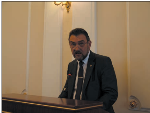
Виступ першого заступника голови Державної служби геології та надр України Миколи Васильовича Фоція

Збільшення обсягів пошуково-розвідувальних робіт та видобутку нафти і газу можли-