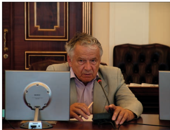
Виступ академіка НАН України Валерія Михайловича Гейця

цілком можливо відновити їх експлуатацію, що може помітно вплинути на загальний видобуток вуглеводнів у нашій країні.