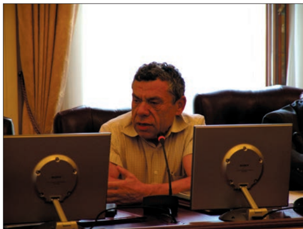
Виступ академіка НАН України Зіновія Теодоровича Назарчука

Проте сьогодні в Україні є досить велика кількість законсервованих свердловин, які свого часу були визнані нерентабельними, але зараз з використанням сучасних технологій