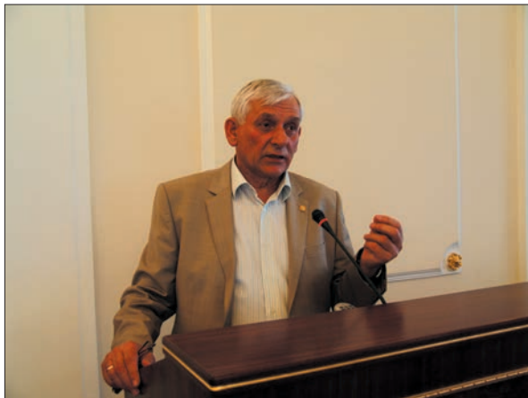
Виступ академіка НАН України Євстахія Івановича Крижанівського

центру теоретичних та прикладних проблем геології за участю установ Міністерства освіти і науки України (Івано-Франківський національний технічний університет нафти і газу, Львівський та Київський національні університети), а також інвесторів з нафтових країн Карпато-Балканської геологічної асоціації та Азербайджану.