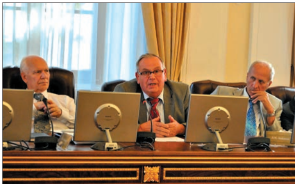
Виступ академіка НАН України Олександра Миколайовича Пономаренка

нафтогазонагромадження і нафтогазоносність. Проведені дослідження геодинамічного і геохімічного аспектів нафтогазонагромадження на території України роблять свій внесок у вирішення всесвітньої проблеми генезису вуглеводнів і формування їх покладів, у створення єдиної несуперечливої теорії походження, міграції і нагромадження нафти та газу. З практичної точки зору отримані результати досліджень дають змогу не лише зрозуміти природу нафтогазоносності земних надр і процесу нафтогазонагромадження, а й відкривають перспективи для вироблення нової уточненої стратегії і тактики пошуків родовищ вуглеводнів, підвищення ефективності пошуків природних вуглеводнів на суші та в акваторіях, що, безумовно, сприятиме енергетичній незалежності України.