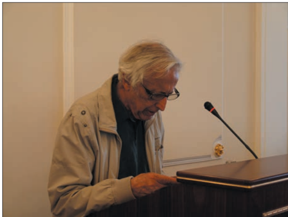
Виступ академіка НАН України Олександра Юхимовича Лукіна

нагромадження, феноменом глибинної гідрогеологічної інверсії тощо. При цьому слід підкреслити глибокий зв'язок сучасної теорії нафтидогенезу з тектоно-геодинамічною моделлю Землі нового покоління, контури якої окреслено в роботах провідних тектоністів на рубежі XX і XXI ст. (В.Ю. Хаїн, Ю.М. Пуцаровський, Р.Г. Гарецький, В.П. Трубіцин та ін.).