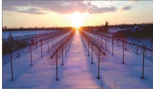
Рис. 3. День весняного рівнодення на радіотелескопі УТР-2, антена схід–захід. 22 березня 2018 р.

Отже, в галузі низькочастотної радіоастрономії Україна вже є успішно інтегрованою до європейського наукового простору. Можна