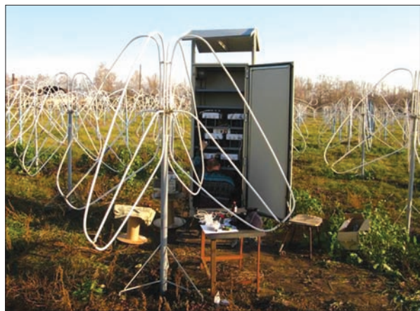
Рис. 5. Субреши́тки широкосмугового радіотелескопа нового покоління ГУРТ, розташованого поруч з радіотелескопом УТР-2 в обсерваторії ім. С.Я. Брауде