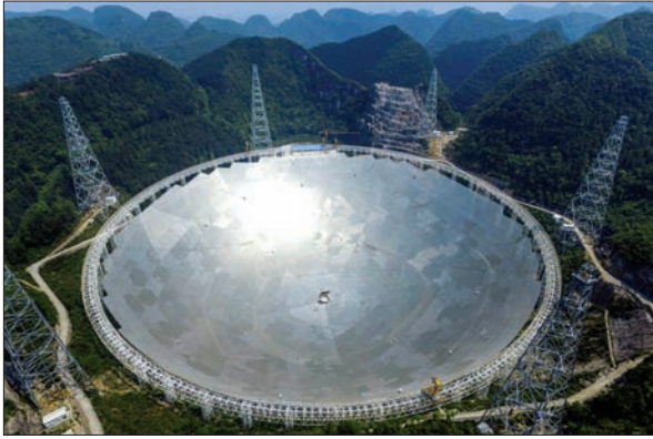
Рис. 1. 500-метровий радіотелескоп FAST (Китай, провінція Гуйчжоу)