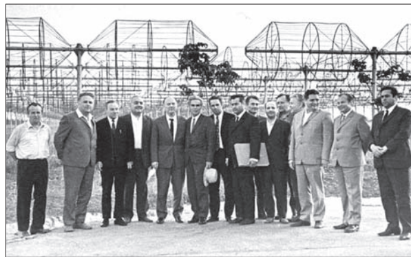
Рис. 4. Учасники виїзного засідання Бюро Президії АН УРСР на чолі з президентом Академії академіком Б.Є. Патеном і академіком С.Я. Брауде, під час якого відбувся офіційний запуск радіотелескопа УТР-2. Червень 1971 р.