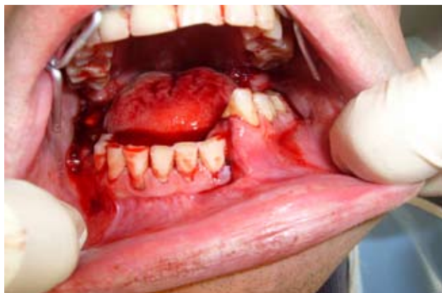
Рис. 1. Хворий О., 28 р., медична карта стаціонарного хворого № 14904, діагноз – перелом нижньої щелепи між 32, 33 зубами зі зміщенням (внутрішньоротова фотографія).

Проведене лікування: 1) операція шинування щелеп індивідуальними шинами Тігерштедта із зачіпними петлями під місцевою провідниковою анестезією, прикус відновлений гумовими тягами; 2) медикаментозне лікування – антибіотикопрофілактика та нестероїдні протизапальні препарати; 3) антисептичні полоскання. Гумові