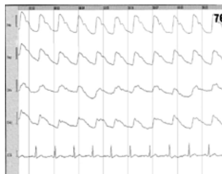
Рис. 4. РЕГ тієї ж пацієнтки П., 57 р., через 30 днів після початку користування знімним протезом.