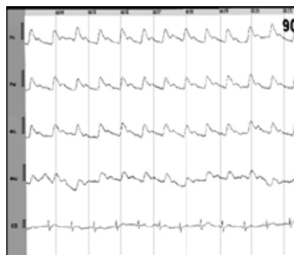
Рис. 2. РЕГ майже в межах норми у пацієнтки групи спостереження П., 57 років.

реважало виявлення гіперкінетичного та гіпокінетичного станів церебральної гемодинаміки, як можливих реакцій на проведення відповідних процедур.