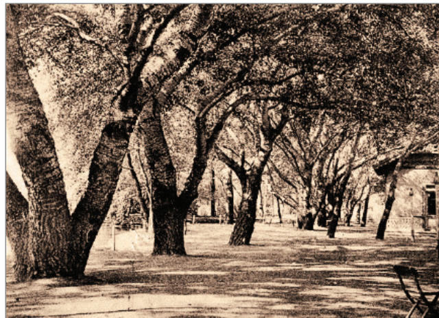
Рис. 4. Хаджибейский парк (фото со старой открытки).

жителей Одессы и прилегающих сел. Существует план переноса Одесского морского торгового порта в Хаджибейский лиман [12], а на освобожденном месте – останется пассажирский флот, яхты и другие маломерные суда. Лиман будет углублен и соединен с морем. Из центра Одессы будут выведены нефтегавань, перегрузка сыпучих грузов и т.п.