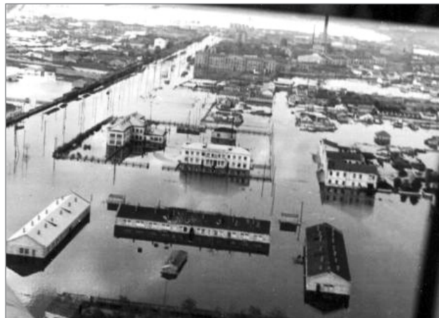
Рис. 1. Затопленная Пересыпь после взрыва дамбы в ночь с 15 на 16 октября 1941 г.

На склонах Куяльницкого лимана изучены и описаны местонахождения наземных обитателей, относимых к следующим стратиграфическим подразделениям позднего кайнозоя: поздний сармат, меотис, поздний плиоцен [18].