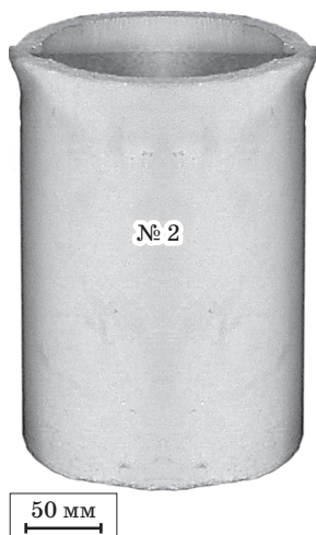
Рис. 1. Плавильный тигель типоразмера № 2

В Украине на моторостроительных предприятиях (АО «МОТОР СИЧ» и ГП «Ивченко-Прогресс» (г. Запорожье, Украина)) применяют при индукционной плавке жаропрочных сплавов (в том числе для изготовления рабочих лопаток турбин низкого и высокого давления реактивных авиационных двигателей) тигли различных составов и типоразмеров, изготавливаемых в ПАО «УКРНИИО ИМЕНИ А. С. БЕРЕЖНОГО» [1—5]. В условиях ГП НПКГ «ЗОРЯ»-«МАШПРОЕКТ» (г. Николаев, Украина) ранее (с 2000-го по 2008 г.) при плавке жаропрочных никелевых сплавов успешно применяли плавильные корундошпинельные тигли типоразмера № 2 (рис. 1), также изготавливаемые в ПАО «УКРНИИО ИМЕНИ А. С. БЕРЕЖНОГО» [6; 7]. В последние годы в ПАО «УКРНИИО ИМЕНИ А. С. БЕРЕЖНОГО» разработаны корундооксидцирконийсиликатные тигли [8; 9], которые успешно испытаны при вакуумной индукционной плавке коррозионностойких сплавов на никелевой и кобальтовой основе серии УСДП, выплавляемых для изготовления покрытий на лопатки с направленной кристаллической структурой в условиях ИЦ «Пратт и Уитни — Патон» [8; 9].