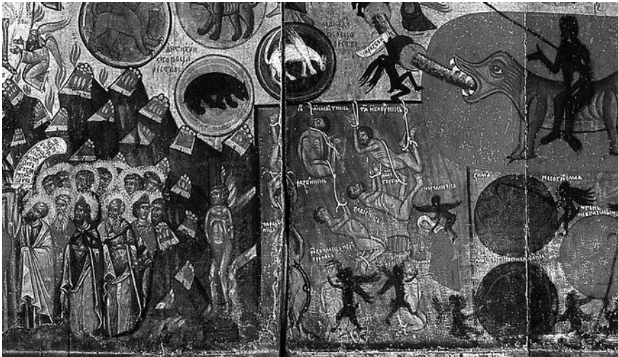
Рис. 13. Фрагменти ікон Страшного суду із сюжетом «Милостивий блудник»: а) Новгород, Третя чверть XV ст. Третьяковська галерея; б) Мишанець Старосамбірського р-ну Львівської обл., остання чверть XV ст. Національний музей у Львові