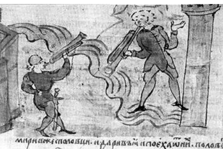
Рис. 12. Колонна, як межовий стовп у мініатюрі Радзивилівського літопису