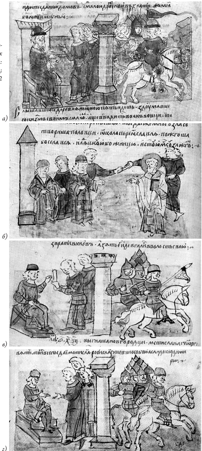
Рис. 10. Зображення окремих колон у мініатюрах Радзивилівського літопису: а) арк. 27; б) арк. 199 зв.; в) арк. 201 зв.; г) арк. 202