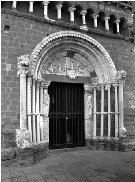
Рис. 7. Архітектурні репліки стовпи єрусалимського храму Яхин та Боаз: а) портал храму Санта-Марія-Маджоре в Тусканії (Лаціо, Італія); б) колони перед порталом храму св. Августина в Андрія (Апулія, Італія)