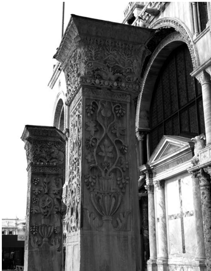
Рис. 8. «Стовпи з Акко», Венеція, Собор св. Марка (первісно – колони церкви св. Полієвкта в Константинополі)