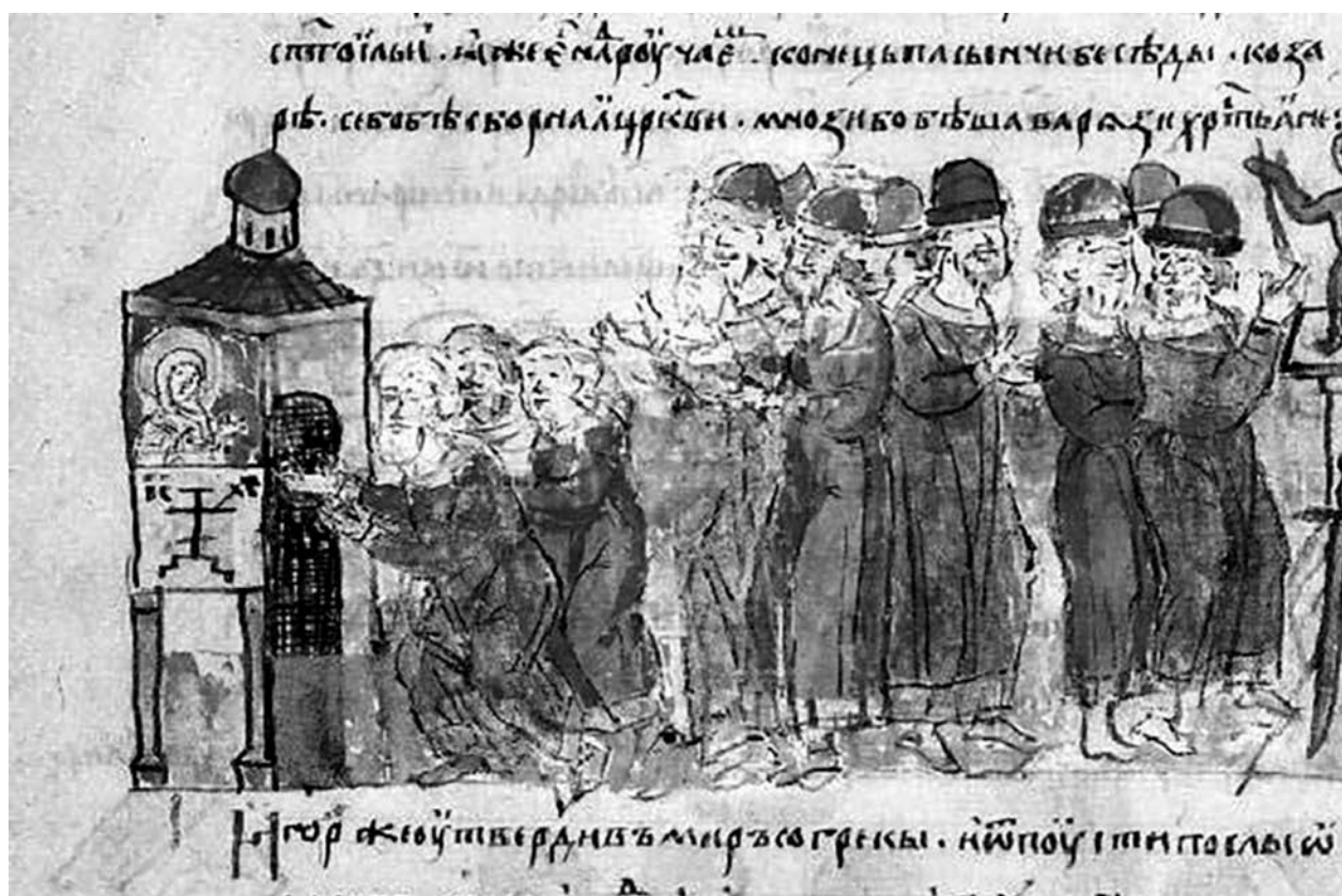
Рис. 4. «Капица» / Колони зі встановленими на них ідолами в мініатюрах Радзивілівського літопису: а) присяга князя Олега, арк. 16; б) присяга князя Ігоря, арк. 26 зв.