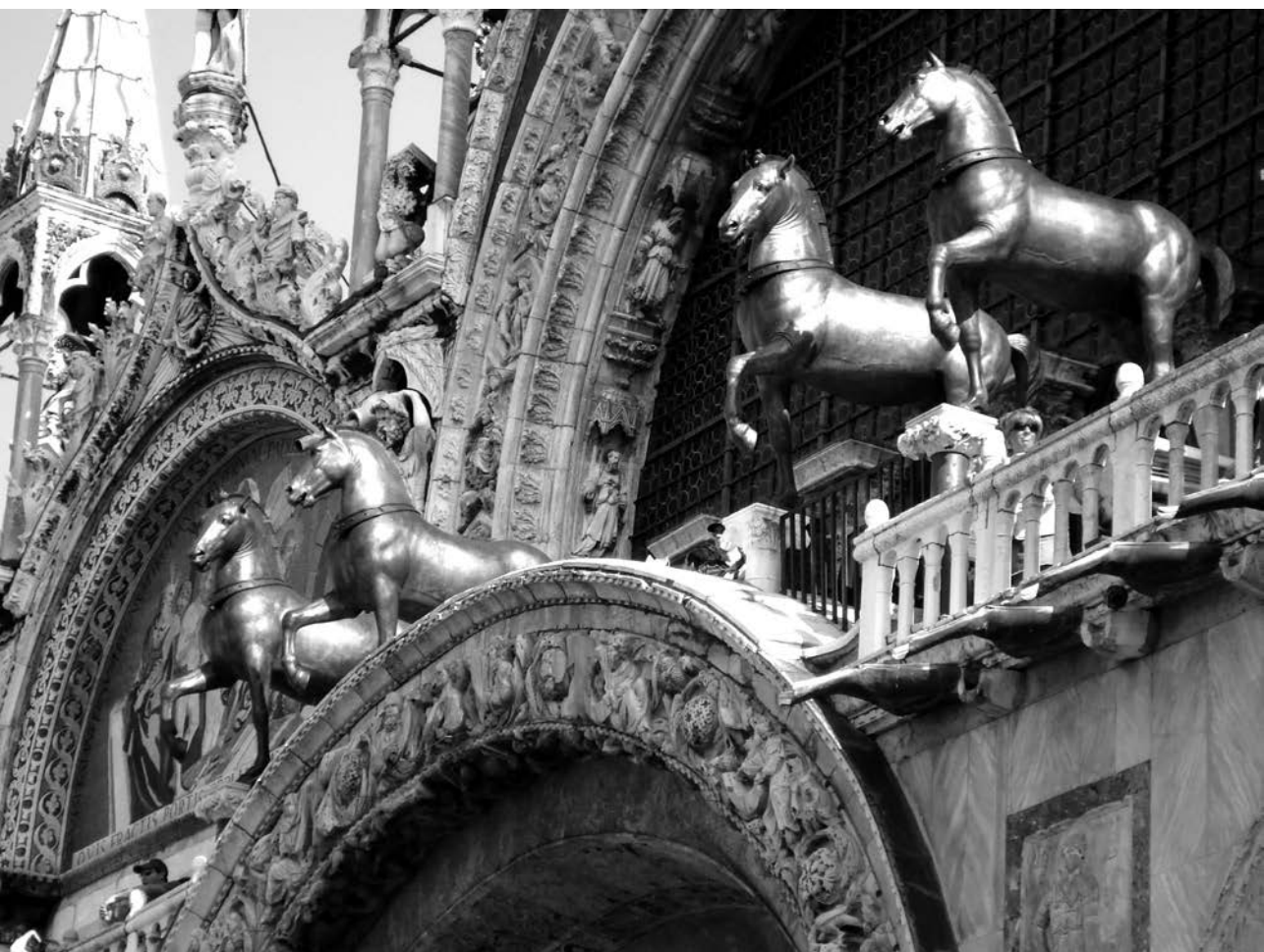
Рис. 3. Четвірка коней з константинопольського Іподрому, встановлена на лоджії собору св. Марка у Венеції

Андрій Грабар висловив припущення, що привезені Володимиром із Корсуня четверо коней могли бути встановленими перед входом до Десятинної церкви, подібно до того, як двісті років пізніше таке положення отримала четвірка коней, вивезена з Константинополя до Венеції й встановлена на фасаді собору св. Марка (рис. 3). Історик