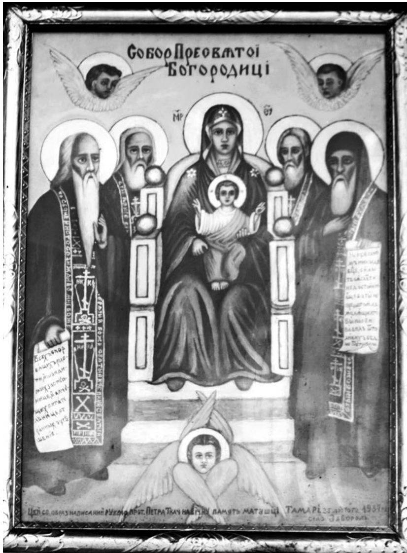
Додаток 3. Ікона Собор Пресвятої Богородиці 1984 р.