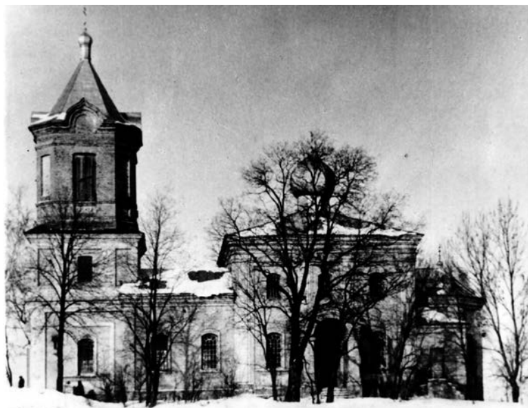
Додаток 5. Вигляд храму до 1943 р.