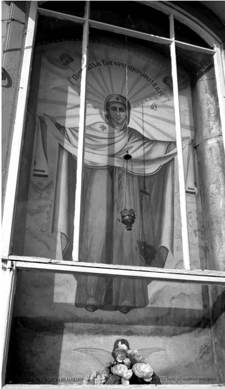
Дод. 2 Ікона Покрови Пресвятої Богородиці, привезена з Грубишівського повіту 1968 р.