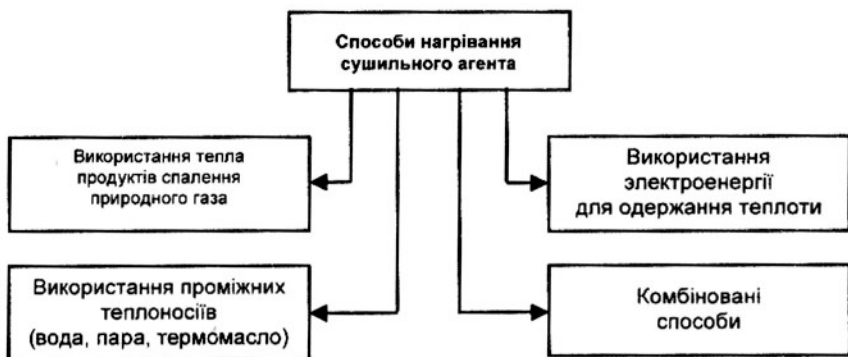
Рис. 2. Способи нагрівання сушильного агента

Вважається, що температура +250\text{ }^{\circ}\text{C} є верхню температурною межею для сушильного агента в ШДМ, оскільки нагрівання сушильного агента вище температури +250\text{ }^{\circ}\text{C} приводить до деструкції барвистих і рельєфообразующих покриттів шпалерного полотна, а також негативно впливає на міцнісні й технологічні властивості самого шпалерного полотна, як основи.