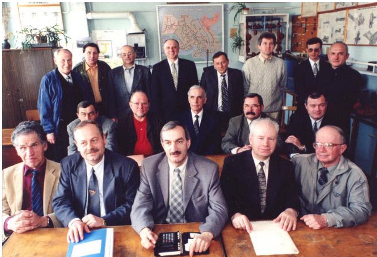
Колектив кафедри теплогазопостачання і вентиляції (2001):