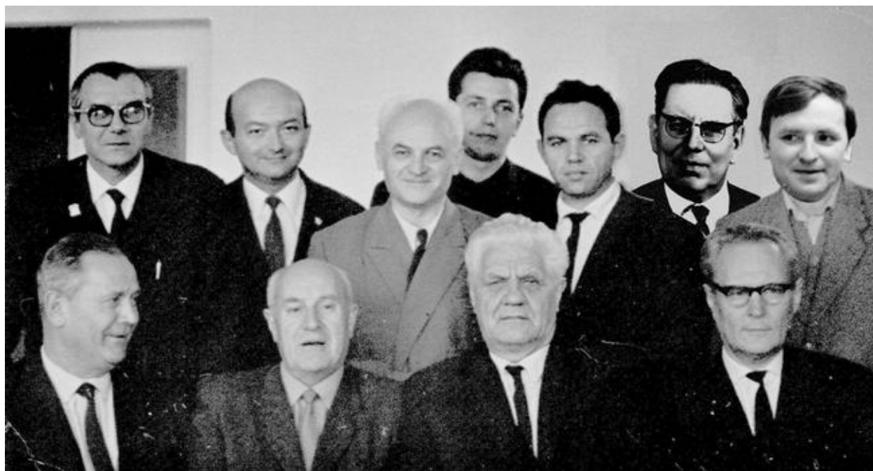
Колектив кафедри теплогазопостачання і вентиляції (1976).