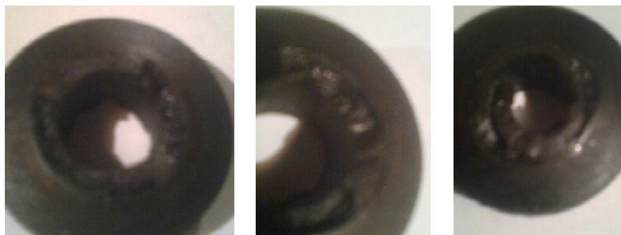
Рис. 3. Виды разрушений краев внутреннего отверстия резиновых элементов