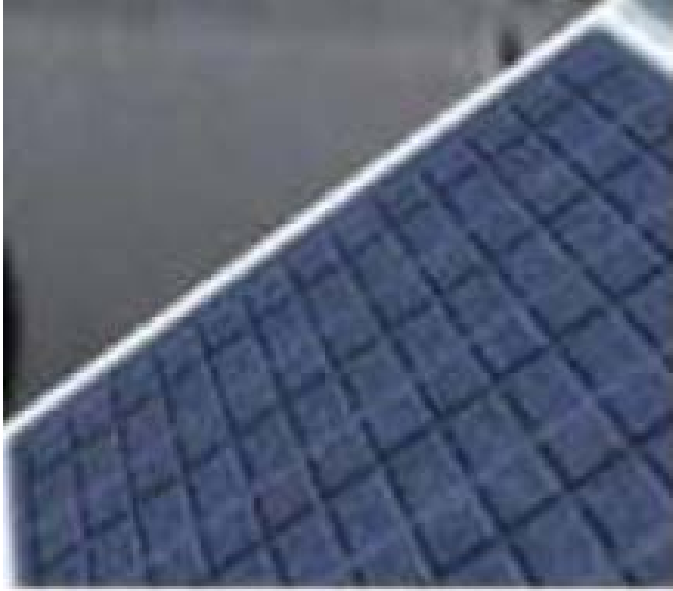
Рис. 2. Изображение с трилинейной интерполяцией текстуры

Больше чем пять эллипсов не понадобилось, так как в ходе исследований не было зафиксировано никакое существенное улучшение в качестве изображения. Если эллипсы превысят степени эллипса с большим эксцентриситетом, например, размещая их вне половины длины центральной линии в каждом направлении, то тогда произойдет смаз (размывание). Метод всегда избегает этого случая. Если эллипсы не покроют эллипс с большим эксцентриситетом, то произойдет алиайзинг. Для крайних случаев, максимальное количество эллипсов ограничено. Метод всегда обеспечивает лучшее качество по сравнению с фильтрацией текстуры, реализованной в аппаратных средствах.