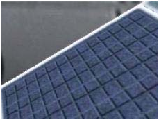
Рис. 3. Изображение с анизотропной фильтрацией текстуры

При тестировании использовался гауссовский фильтр с отклонением 0.5 и шириной в один пиксель. Настройка отклонения фильтра влияет на точность или гладкость изображения. Меньшее отклонение создает более резкое изображение, но может привести к алиайзингу, когда используется текстура с высокочастотными компонентами. В тестах найдено, что отклонение 0.5 дает хороший компромисс между предотвращением алиайзинга и смазом изображения.