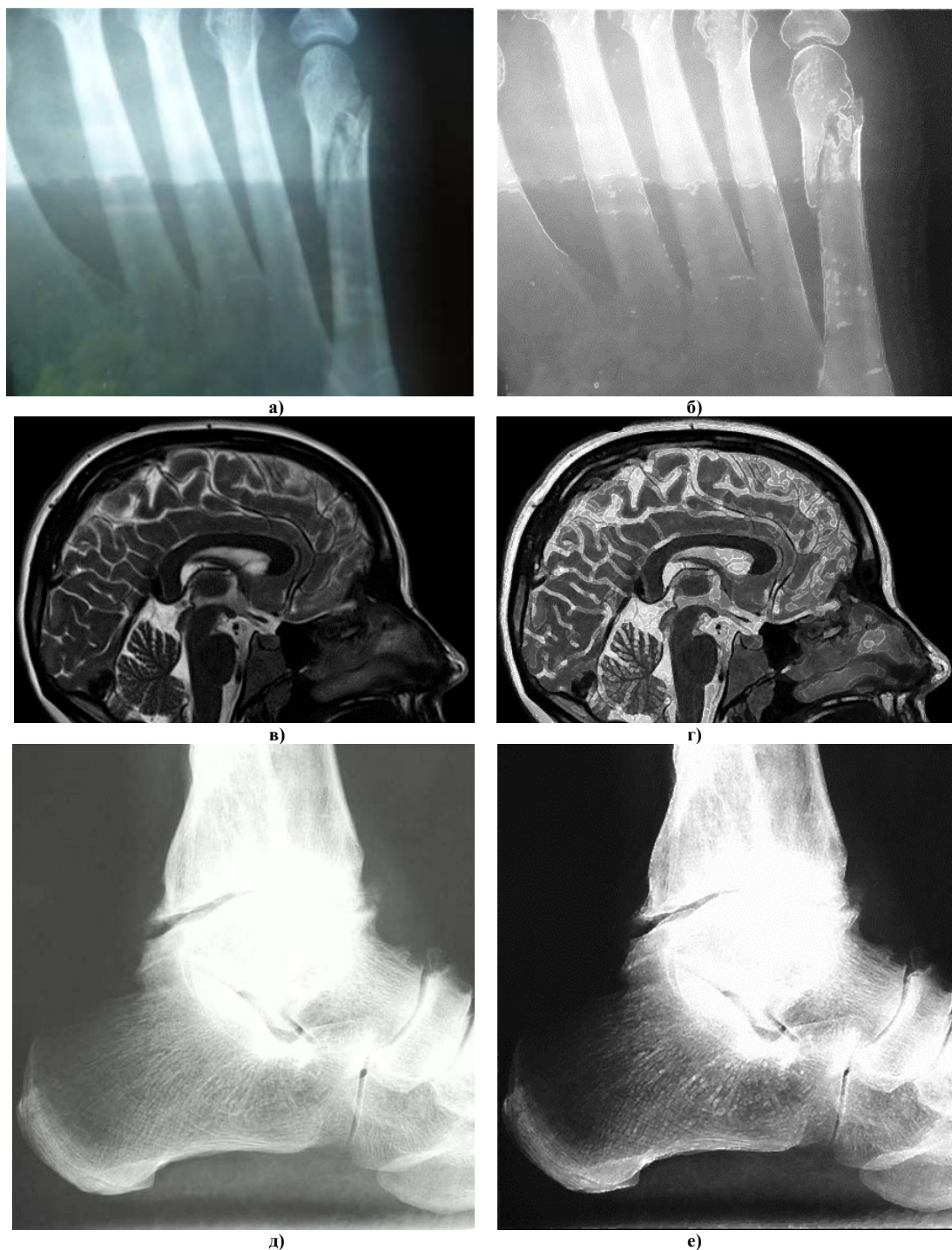
Рис. 6. Результати комбінованого застосування методів цифрової корекції та підвищення якості для рентгенівських знімків, різної складності, а), в), д) – вхідні зображення різних класів; б), г), е) – оброблені зображення

Результати оброблення зображень вищевказаними методами в межах проведених досліджень наведено на рис. 5.