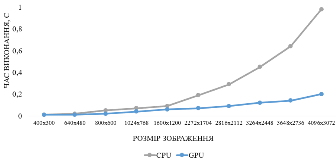
Рис. 4. Порівняння швидкодії роботи алгоритму еквалізації гистограми зображення на основі CPU- та GPU-орієнтованих апаратних платформ

У проведених дослідженнях при порівнянні швидкодії роботи алгоритмів підвищення якості зображення на CPU- та GPU-орієнтованих платформах (рис. 4), було виявлено незначне прискорення (близько 0,01 – 0,02 мс) роботи алгоритмів на GPU-орієнтованій платформі при обробленні зображень розмірністю до 1600×1200 пікселів. Із збільшенням розмірності зображень швидкодія оброблення на GPU-орієнтованій платформі значно зростає.