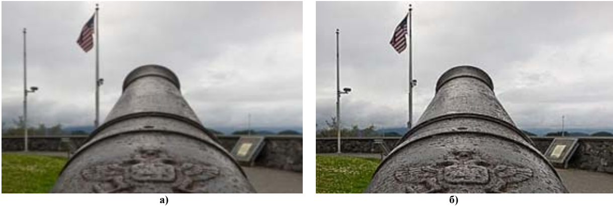
Рис. 3. Результати застосування фільтра для підвищення різкості зображення, а) вхідне зображення, б) зображення із підвищеною різкістю

Приклад фільтрації зображення для підвищення різкості наведено на рис. 3.