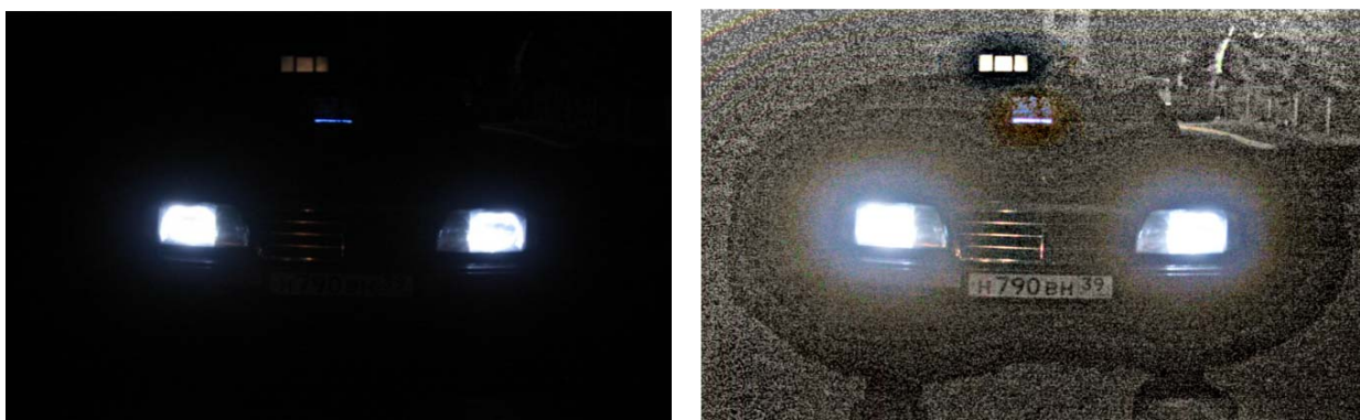
Рис. 2. Результати оброблення зображень алгоритмом Retinex, а) вхідне зображення, б) зображення із вирівняним освітленням

Результати оброблення зображень за даним алгоритмом в межах проведених досліджень наведено на рис. 2.