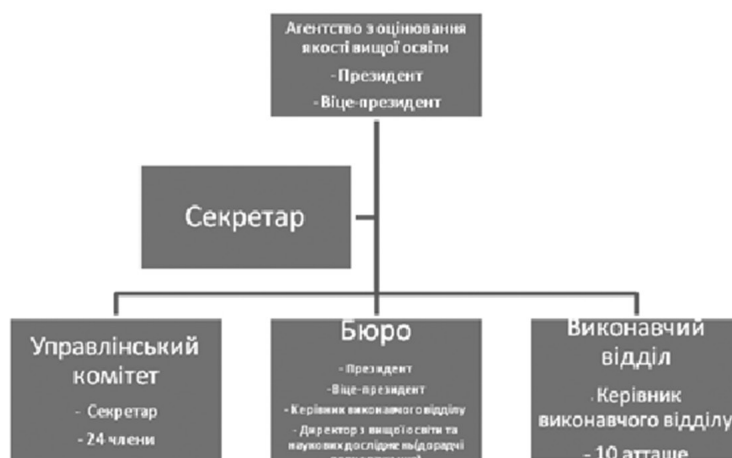
Рис. 1. Організаційна структура Агентства з оцінювання вищої освіти у Громадах Валлонії та Брюсселя

Згідно з методологічним гідом координатора [7] на першому етапі оцінювання відбувається мобілізація учасників процесу в закладі для здійснення самооцінки. Результатом цієї фази є редакція звіту із самооцінки на основі методики Агентства,