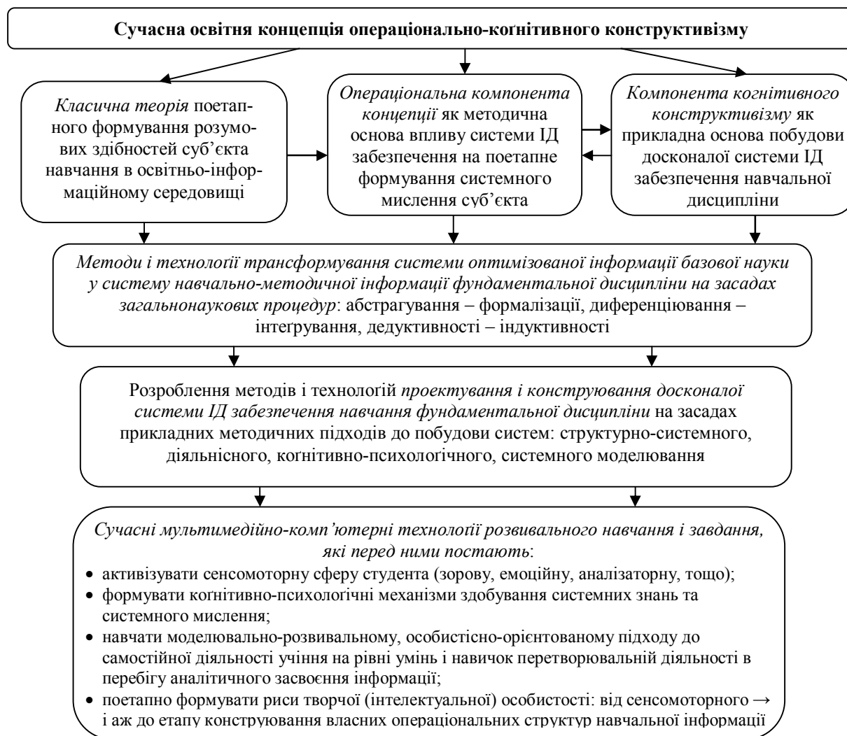
Рис. 2. Структурно-логічна схема, що ілюструє вплив освітньої концепції на досконалість системи інформаційно-дидактичного забезпечення навчального процесу з фундаментальних дисциплін, отже, і на інтенсивність, ефективність та якість навчання.

ція знань) з чіткою ієрархізацією структури і функцій, узгодженість дій елементів системи тощо;