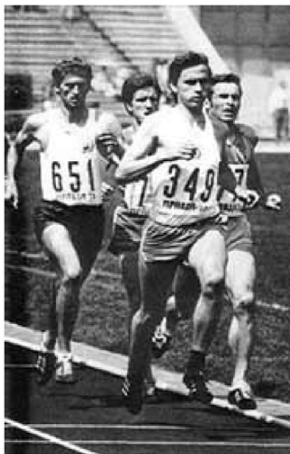
Фото 1. Євген Аржанов (№349)

Цікаво, що норматив майстра спорту в бігу на 800 м Євген виконав всього за кілька місяців тренувань. 1967 року дев'ятнадцятирічний спортсмен перемагає на першості Радянського Союзу серед юніорів. Олімпіада в Мехіко була невдалою. Після неї, змінивши тренера, він виборює перемогу на трьох чемпіонатах Європи: двох зимових (1970–1971 рр.) і одному літньому (1971 р.).