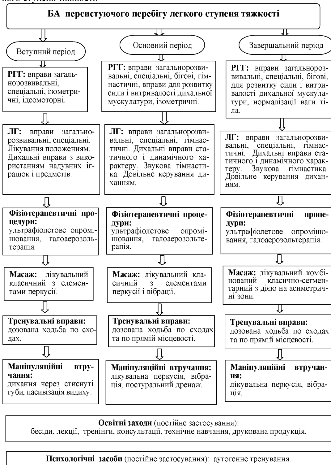
Рис. 2. Алгоритм формування фізичної реабілітації хворих на БА персистуючого перебігу легкого ступеня тяжкості

Не змінюючи в цілому склад програми, проведено її адаптацію за послідовністю та інтенсивністю виконання залежно від трьох ступенів тяжкості перебігу БА й запропоновано спеціальні програми ФР, адекватні клінічному й фізичному стану хворих при кожному ступені тяжкості захворювання. Як приклад, на рис. 2 подано алгоритм складання спеціальної програми ФР хворих на БА персистуючого перебігу легкого ступеня тяжкості.