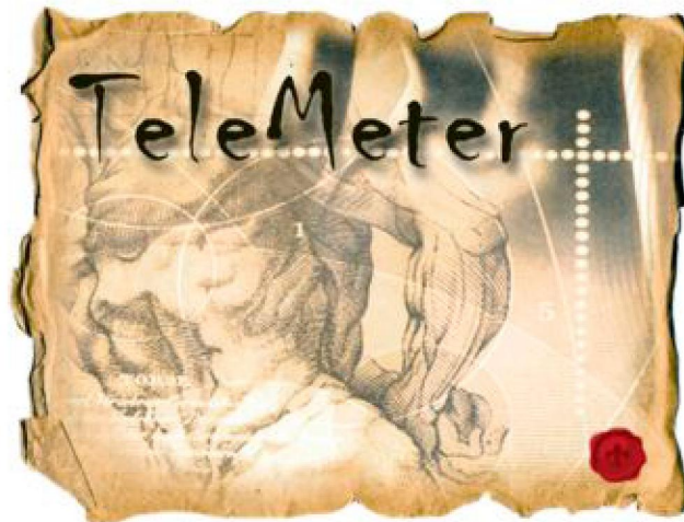
Рис. 4. Роздруківка з екрана комп'ютера. Головне вікно вимірювально-інформаційної системи "Telemeter" [7]

Основними функціональними компонентами вимірювально-інформаційної системи "Telemeter" є: інформаційний модуль, модуль "Просторова організації тіла людини", модуль "Результати вимірів", модуль "База даних" (рис. 5).