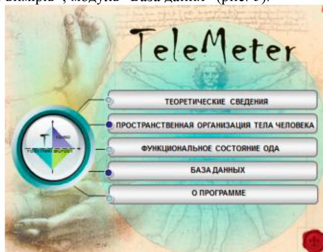
Рис. 5. Роздруківка з екрана комп'ютера. Меню вимірювально-інформаційної системи "Telemeter" [7]

Основними функціональними компонентами вимірювально-інформаційної системи "Telemeter" є: інформаційний модуль, модуль "Просторова організації тіла людини", модуль "Результати вимірів", модуль "База даних" (рис. 5).