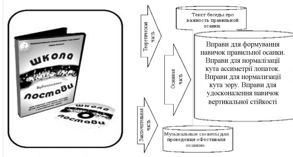
Рис. 3. Аудіопрограма “Школа постави” [2]

А.А.Дяченко [2], розробляючи технологію корекції порушень постави школярів з порушенням зору, апробував авторську аудіопрограму “Школа постави” (рис. 3). Як відзначає фахівець, компенсація порушень зору відбувається, зокрема, за рахунок слуху й тому необхідною умовою ефективного виконання вправ молодшими школярами з ослабленим зором є навчання комбінації м’язових відчуттів зі звуковим фоном. Реалізація звукового супроводу під час виконання комплексів вправ можлива при використанні озвучених м’ячів, ударів, музики. Запис тексту для програми проводився в такій послідовності: текст оповідання “Правильна постава – секрет краси й здоров’я”, текстовий компонент комплексів корекційно-профілактичних вправ, невеликі музичні сюжети для використання під час проведення “Фестивалю постави”.