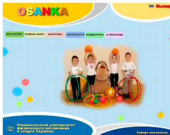
Рис. 2. Вікно програми “Osanka” – “Меню”. Роздруківка з екрана комп’ютера [5]

На рис. 2 зображене меню програми з переліком усіх вкладок програми й гіперпосилань.