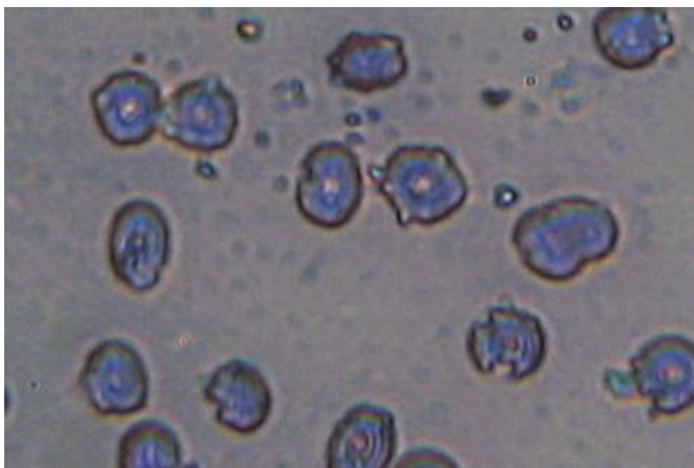
Рис. 3. Структурні перетворення еритроцитів периферичної крові пацієнта Б., вік 35 років (І.Б. №24462/14). Метод: фазово-контрастна темнопольна мікроскопія. Зб.: х 4800.