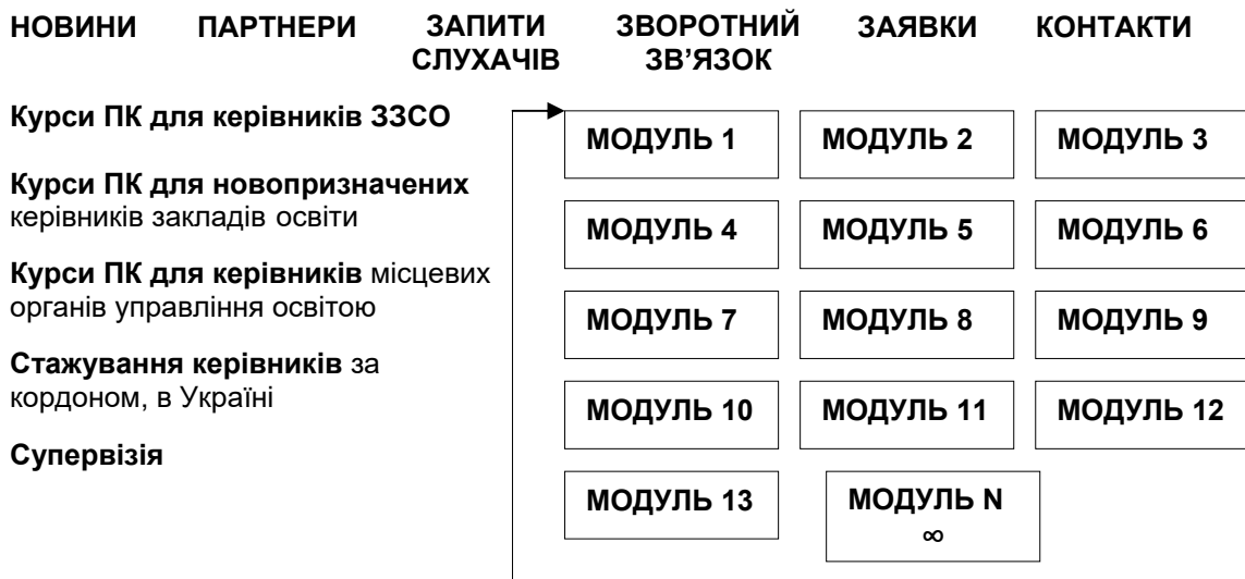
Рис. 2. Модель сайту освітнього кластеру «Бюро успішних кар'єр»