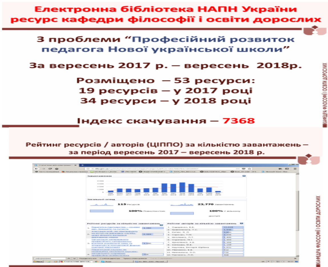
Рис. 2. Науково-методичні матеріали кафедри філософії і освіти дорослих ЦППО з питань Нової української школи в Електронній бібліотеці НАПН України

На сторінці кафедри філософії і освіти дорослих, психології управління, ВОС та ІКТ сайту ЦППО для замовників освітніх послуг розміщено збірники матеріалів Е-конференцій, присвячених означеній проблемі.