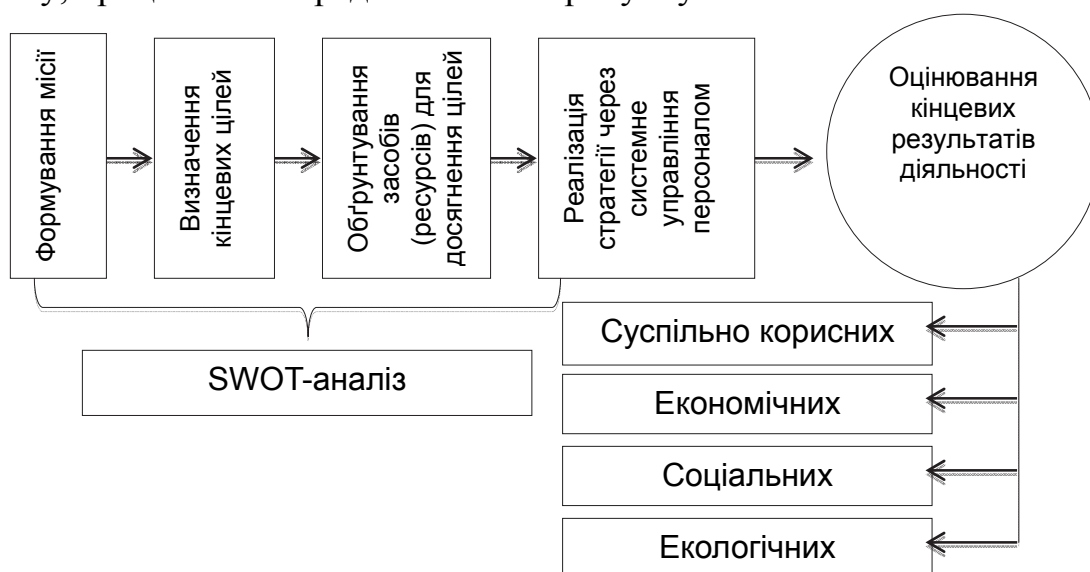
Рис. 1. Процес стратегічного менеджменту в будь-якій організації

Ключовою відмінністю КЦУ від КАТ є чітке органічне підкорення системи управління персоналом стратегічним цілям функціонування всієї організації. Тобто пріоритет стратегічного розвитку організації визначає систему управління персоналом. Саме персонал забезпечує реалізацію всієї стратегії і є найважливішою органічною складовою всього стратегічного менеджменту, процес якого представлено на рисунку 1.