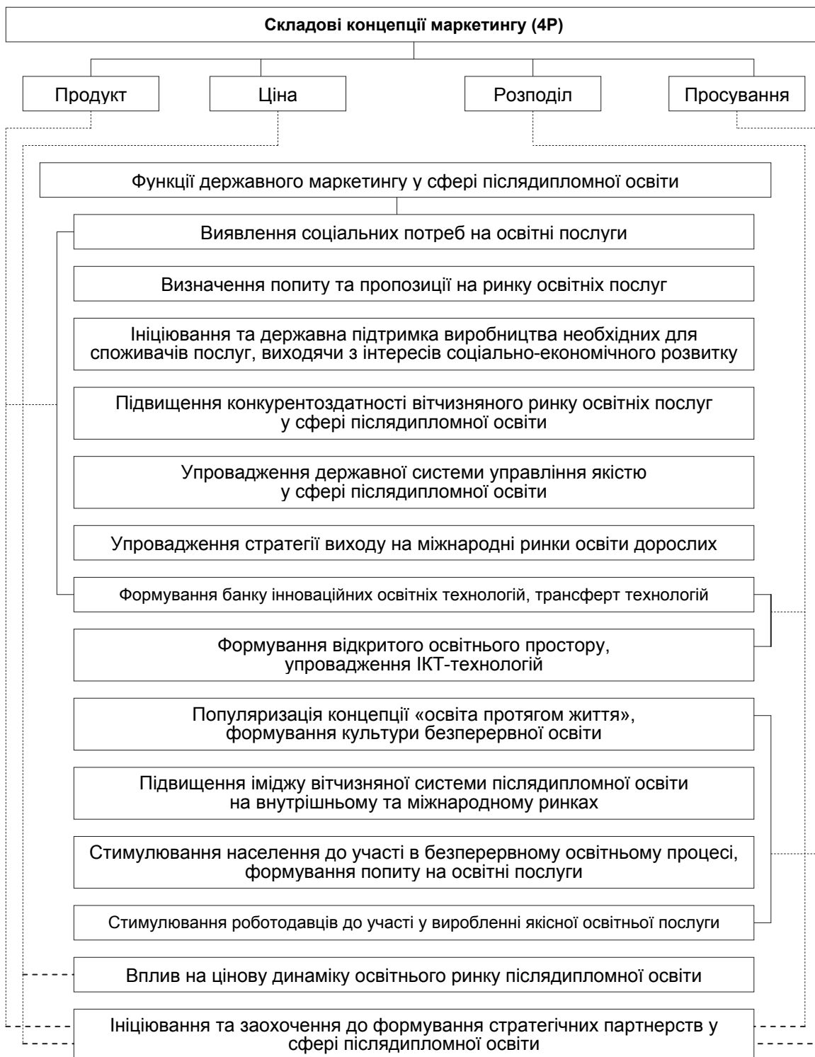
Рис. 1. Основні функції державного маркетингу у сфері післядипломної освіти

Отже, одним із основних суб'єктів системи державного маркетингу (рис. 2, джерело розроблено автором) є уряд та органи державної влади, основні функції яких розглянуто вище. Активними суб'єктами маркетингу є безпосередньо освітні заклади різноманітної форми власності, які працюють у сфері післядипломної освіти та освіти дорослих. Такі заклади можуть упроваджувати маркетингову концепцію у свою внутрішню діяльність