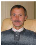
Фото авторів (2,5×3 см). Для кожного автора: прізвище, ім'я, по батькові; вчений ступінь; дати захисту дипломів і дисертацій, місце захисту; місце роботи, посада; короткий опис напрямів наукової діяльності – за зразком, інші відомості – на розсуд автора.