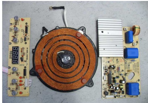
Рис. 1 – Плоский багатовитковий індуктор індукційної плити

Основні фізичні процеси в індукційних кухонних плитах та посуді, що нагрівається, та їх взаємний зв'язок. Основним вузлом індукційної кухонної плити є індуктор [1] – плоска одновиткова або багатовиткова котушка, при протіканні по якій змінного струму створюється електромагнітне поле, яке індуктує в свою чергу вихрові струми в посуді, що нагрівається. Конструкція індуктора індукційної плити представлена на рис. 1. Крім того, протікання вихрових струмів та обумовлена цим зміна теплового стану мають місце в самому індукторі, а також у феритовому магнітопроводі плити.