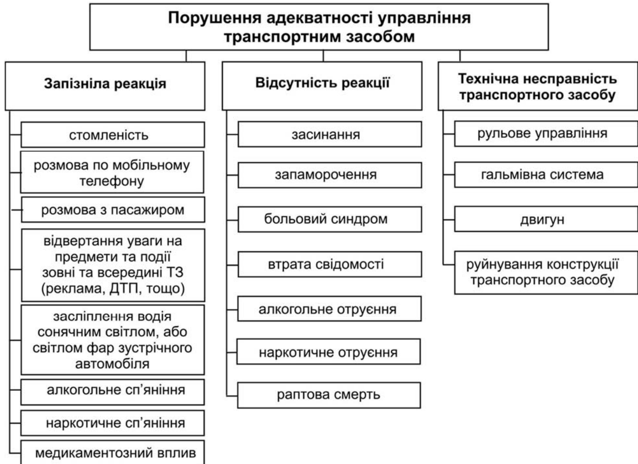
Рис. 1. Класифікація основних причин порушення адекватності управління транспортним засобом

несправність транспортного засобу (ТЗ). На підставі детального аналізу відзначених причин пропонується класифікація порушень, які впливають на адекватність управління. Запропонована класифікація подана (рис. 1).