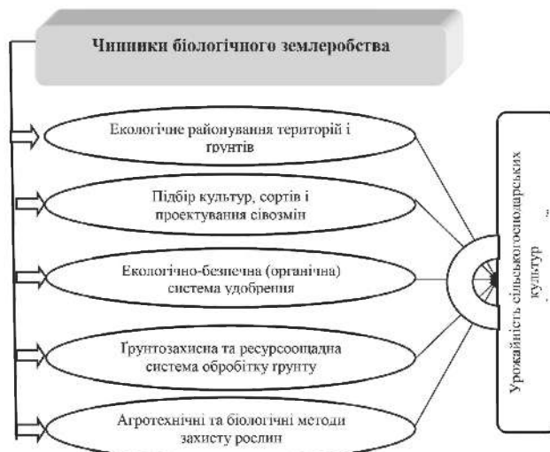
Рис. 1. Чинники біологічного землеробства, що впливають на показники ґрунтової родючості, врожайність сільськогосподарських культур та якість продукції рослинництва

Однак, на сьогодні у виробництві часто має місце недосконалість науково обґрунтованих сівозмін. Причин, що зумовлюють є багато, серед них: відсутність планового ведення рослинницької галузі; поділ культур на ринкові і неринкові або на прибуткові і збиткові; відмова від рекомендованої структури посівних площ; недотримання рекомендованих строків повернення культур на попереднє місце вирощування; занепад тваринницької