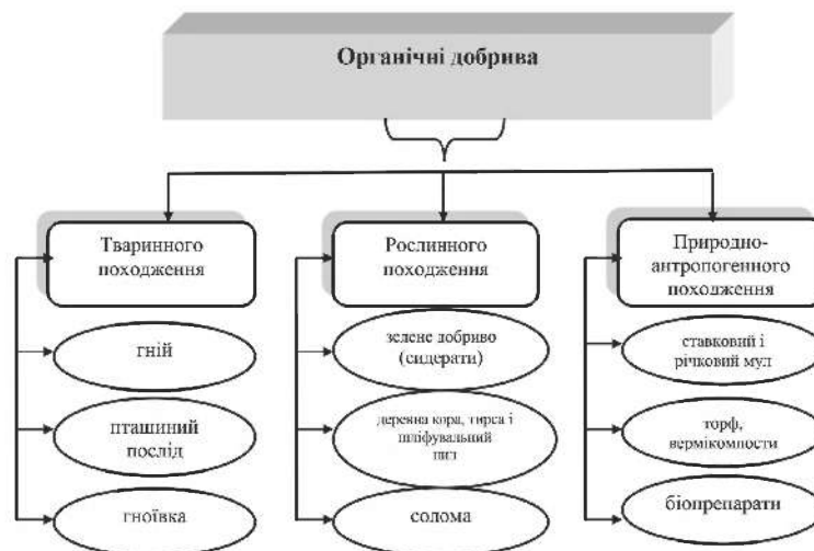
Рис. 2. Види органічних добрив за їх походженням