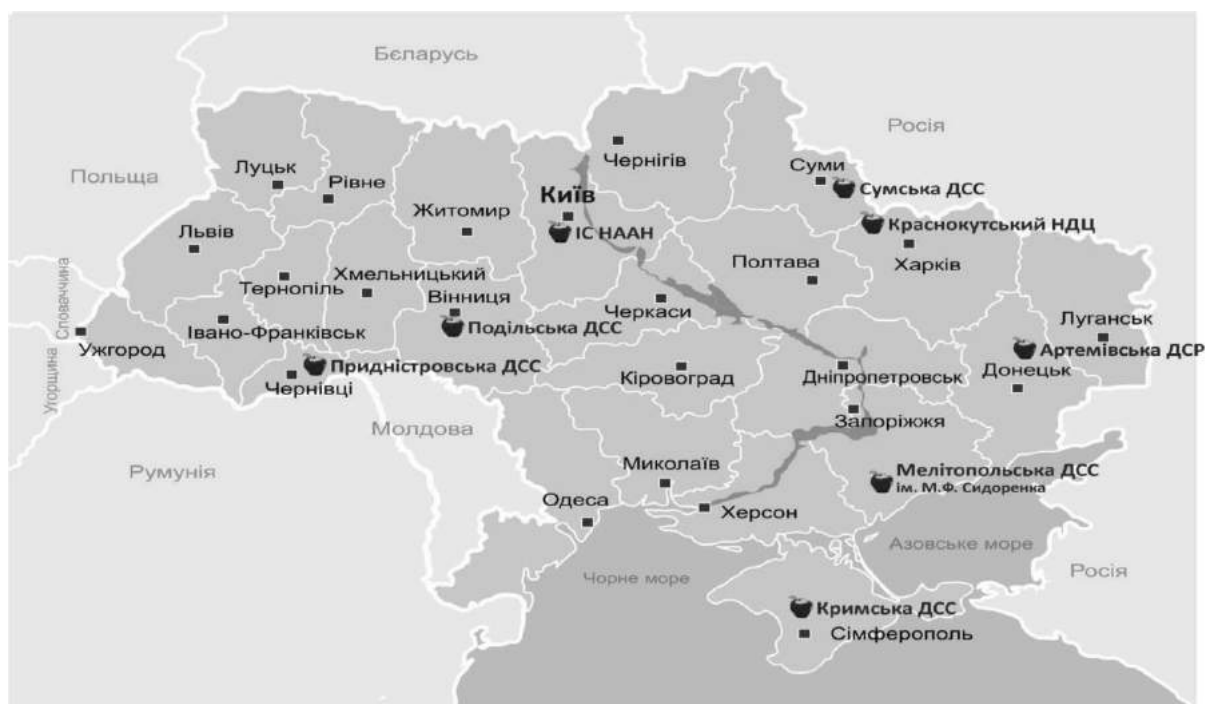
Рисунок 1 – Мережа установ Інституту садівництва Національної академії аграрних наук України.

Основна частина. Моніторинг стану насаджень плодкових та ягідних культур в Україні здійснюється мережею дослідних станцій та установ, що входять НЦ «Плодівництво» (рис. 1).