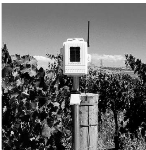
Рисунок 3 – Ґрунтовий блок метеостанції

Ґрунтовий блок дозволяє контролювати температуру ґрунту (4 датчика), вологість ґрунту (4 датчика) (рис. 3).