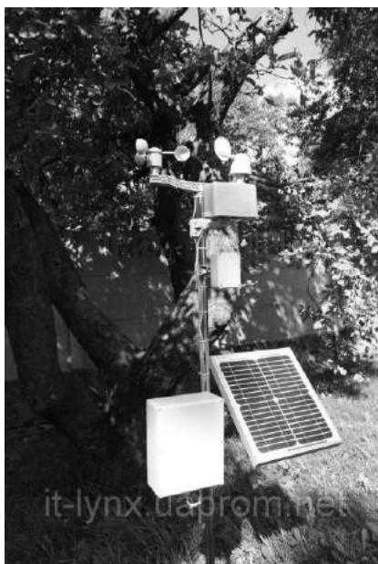
Рисунок 4 – Метеостанція «Інспектор-метео»

Метеостанції DAVIS під час роботи проявили себе достатньо надійними, що не потребують постійного технічного контролю і не вимагають специфічних навичок під час експлуатації. Однак вони мають суттєвий недолік – обмежену кількість датчиків ґрунтового блоку, але головне незначну відстань (до 200 м) передачі інформації на прийомну консоль. Тому більш перспективним є використання інтернет метеостанцій, наприклад, iMETOS виробництва австрійської компанії Pessl Instrument. Однак метеостанції такого класу на даний час надзвичайно дорогі, тому вдалою альтернативою повинна стати он-лайн метеостанція «Інспектор Метео». Це новий продукт української фірми «Ай Ті-Лінкс», що являє собою програмно-апаратний комплекс (рис. 3).