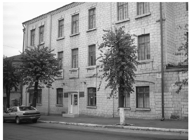
Фото 1. Вінницький обласний шкірно-венерологічний диспансер.