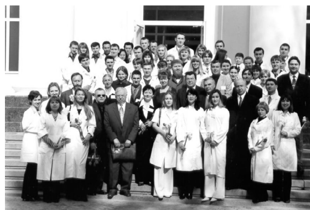
Фото 10. Всеукраїнська студентська олімпіада та наукова конференція з дерматовенерології (2002 р.).

З грудня 2009 року завідувачем кафедри шкірних та венеричних хвороб обраний за конкурсом на Вченій