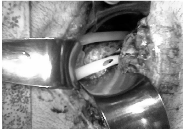
Рис. 3. Дренирование сальниковой сумки.