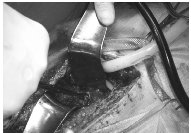
Рис. 1. Перший етап некрэктомії кінцевим зажимом.

Абдомінізацію підшлунковою залози, на нашому думку, виконувати необхідно, так як цей етап операції направлений на декомпресію парапанкреатическої клітинки, адекватну евакуацію панкреатогенного і/або інфікованого високотоксичного випота. Некрэктомію (видалення некротизованих тканин в межах кровоснабжених зон, пов'язаних з паренхімою органу) або секвестрэктомію (видалення вільно лежачих некротических тканин в межах померлих