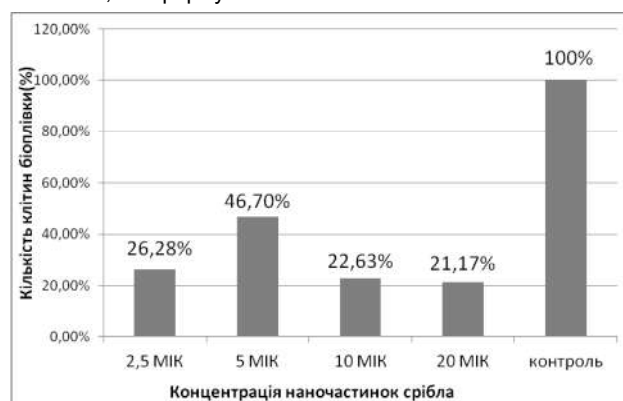
Рис. 3. Вплив різних концентрацій наночастинок срібла на об'єм сформованої біоплівки (3 доби).

ту мікроорганізмів з препаратом наносрібла та відображають поступове зниження кількості мікроорганізмів під впливом наночастинок срібла в досліджуваному зразку. Кількість E. faecalis (КУО/мл) в експериментальному зразку була достовірно нижчою, порівняно з контролем ( p \leq 0,05 ).