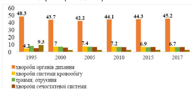
Рис. 3. Питова вага захворювань за класифікацією хвороб в Україні (%) за 1995-2017 рр.

86% летальних випадків становлять хронічні неінфекційні захворювання (ХНІЗ). У 2015 р. відповідно за даними ВООЗ Україна посіла 103 місце серед 183 країн світу за показниками рівня середньої очікуваної тривалості життя (СОТЖ) і тому населення України в порівнянні з країнами ЄС живуть на 10 років менше [17].