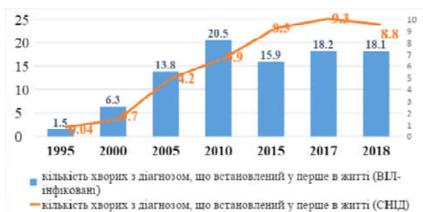
Рис. 4. Динаміка показників хворих ВІЛ-інфікованих та хворих на СНІД з діагнозом, що встановлений у перше в житті за 1995-2018 рр.

нофонду сучасного суспільства залежить від безпеки та якості харчових продуктів. Порушення харчового ланцюга, який охоплює від сільськогосподарського, промислового виробництва і до зберігання, пакування та вживання недоброякісних продуктів може бути основною причиною захворювань та спалахів. За статистичних даними у 2016 р. таких спалахів зареєстровано по Україні 162 випадки і, відповідно 3045 потерпілих перебували на лікуванні в інфекційних лікарнях, де фактором передачі виступали харчові продукти. Аналіз даних проведених досліджень за період 2008-2016 рр. (табл. 1) показує зниження невідповідних проб за мікробіологічними показниками до 2015 р., але ми повинні враховувати період зменшення контролю санітарно-епідеміологічної служби, в зв'язку з її реорганізацією, яку на даний час в період пандемії Covid-19, починають відновлювати як необхідний контролюючий орган у державі. Проте, за статистичними даними рівень захворюваності на гострі кишкові інфекції (ГКІ) зріс у 2017 р. на 16,5% у порівнянні з 2016 р. і з 2008 роком мав тенденцію до зростання [13].