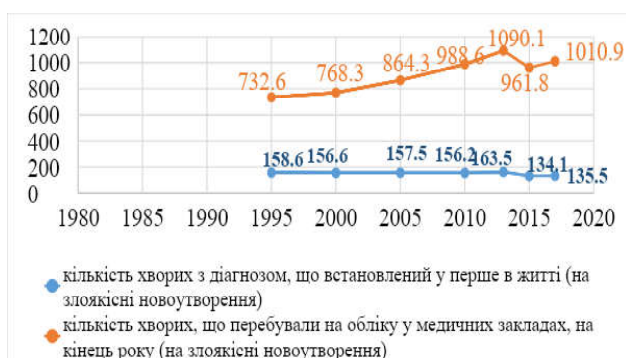
Рис. 6. Динаміка показників захворюваності на злоякісні новоутворення за період 1995-2017 рр.