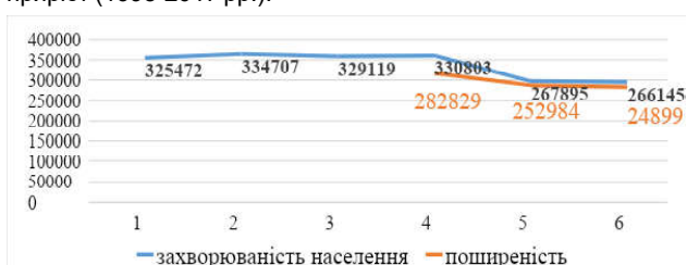
Рис. 2. Динаміка показників захворюваності та поширеності населення України (на 100 тис.).