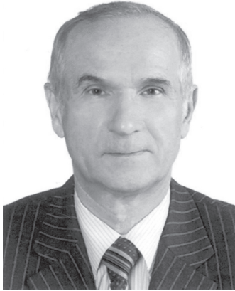
Ф.М. Марчук, начальник науково-дослідної частини Академії суддів України