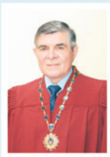
Голова Верховного Суду України

Нехай свято Незалежності додасть Вам наснаги і творчих здобутків в ім'я процвітання Батьківщини, а у Ваших домівках панує мир і щастя.