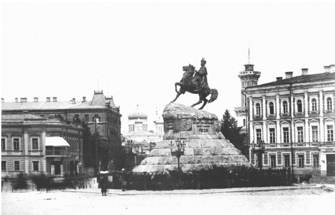
«Присутственні місця» (праворуч) — приміщення Генерального Суду УНР (Фото поч. XX ст.)