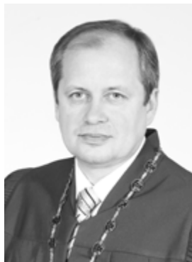
Я. М. Романюк, Голова Верховного Суду України, кандидат юридичних наук, заслужений юрист України