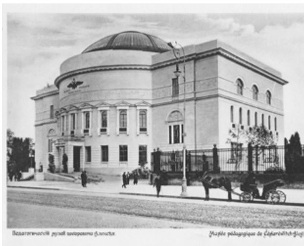
Будинок Української Центральної Ради, в якому у 1917—1918 рр. містилися установи Центральної Ради та Генеральний Секретаріат України (Фото поч. XX ст.)

Після проголошення УНР Секретаріатом судових справ на розгляд УЦР було подано два законопроекти. Перший визнавав усі державні установи та інституції, що працювали на території України до 7 листопада 1917 р., з їх правами, сферою діяльності, штатами та визнавав ці інституції органами УНР із 7 листопада 1917 р. У другому, поданому до УЦР 25 листопада та затвердженому того ж дня, йшлося про те, що всі закони, постанови й розпорядження, які були видані російським урядом до 27 жовтня 1917 р. і не були скасовані чи замінені універсалами УЦР, мають обов'язкову силу на території УНР, видання ж нових законів, заміна старих, скасування постанов і розпоряджень на території УНР є виключним і неподільним правом УНР. Ці законопроекти увійшли до Закону Центральної Ради під назвою «Про виключне право Центральної Ради видавати законодавчі акти УНР» від 25 листопада 1917 р. 7