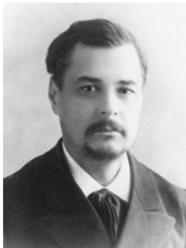
С.П. Шелухін, Генеральний суддя Генерального Суду УНР (Фото поч. XX ст.)

установ Української Народної Республіки від судової системи Тимчасового уряду Росії». 23 грудня 1917 р. Центральною Радою було прийнято Закон «Про умови обсаджування і порядок обрання суддів Генерального та апеляційного судів».