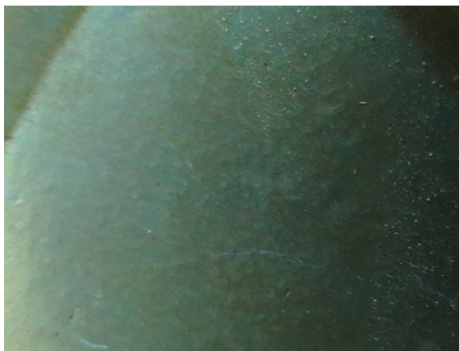
Рис. 1. Оксидное покрытие модифицированное таннином, полученное вибрационным способом после 685 часов коррозионных испытаний в 3%-ном растворе хлорида натрия. Материал образцов АДО

Работы, проведенные нами по модификации оксидирующего раствора, показали положительные результаты. Так, при введении в оксидирующий раствор таннина, в количестве 0,5 г. на литр, антикоррозионные свойства покрытия значительно возросли. Можно предположить, что таннин гидролизуясь в растворе переходит в галловую кислоту, которая, взаимодействуя с оксидом алюминия, образует соединения, способствующие повышению коррозионной стойкости покрытия. Есть сведения о том, что таннин способствует повышению электрической прочности покрытия. На рис. 1 представлено оксидное покрытие, модифицированное таннином после коррозионных испытаний в 3-х % растворе хлорида натрия.