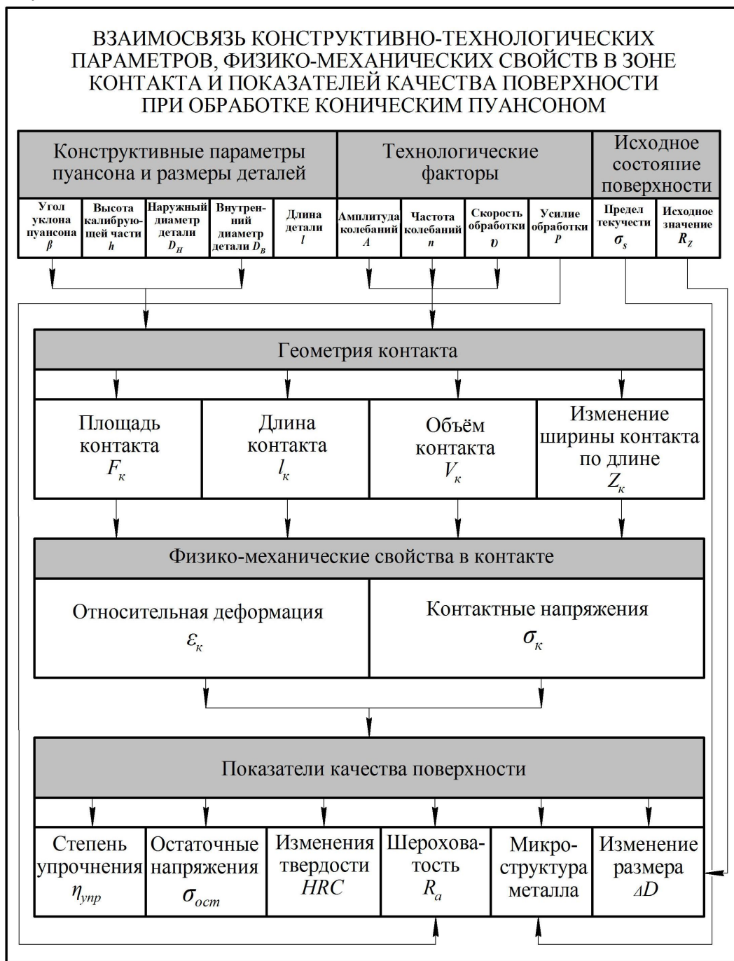
Рис. 1. Схема взаимосвязи

Большое количество величин, влияющих на качество поверхностного слоя, затрудняет выбор оптимального сочетания их значений. Для наглядного представления взаимосвязи конструктивно-технологических параметров обработки, физико-механических свойств и показателей качества при поверхностном пластическом деформировании нами разработана схема (рис. 1).