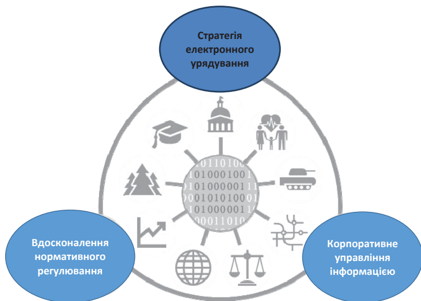
Рис. 2. Перехід до електронного урядування

На підставі проведеного фахівцями Держатомрегулювання та ДНТЦ ЯРБ аналізу, зокрема з урахуванням досліджень групи Gartner [3, 4], можна виділити такі тренди: розвиток електронного урядування, перехід сфери прийняття управлінських рішень і взаємодії між Установами та громадянами на рівень Інтернет-комунікацій (рис. 2);