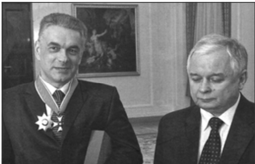
Януш Куртика та Лех Качинський. 2009 р.