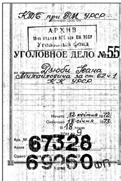
Обкладинка одного з томів слідчої справи І. Дзюби.