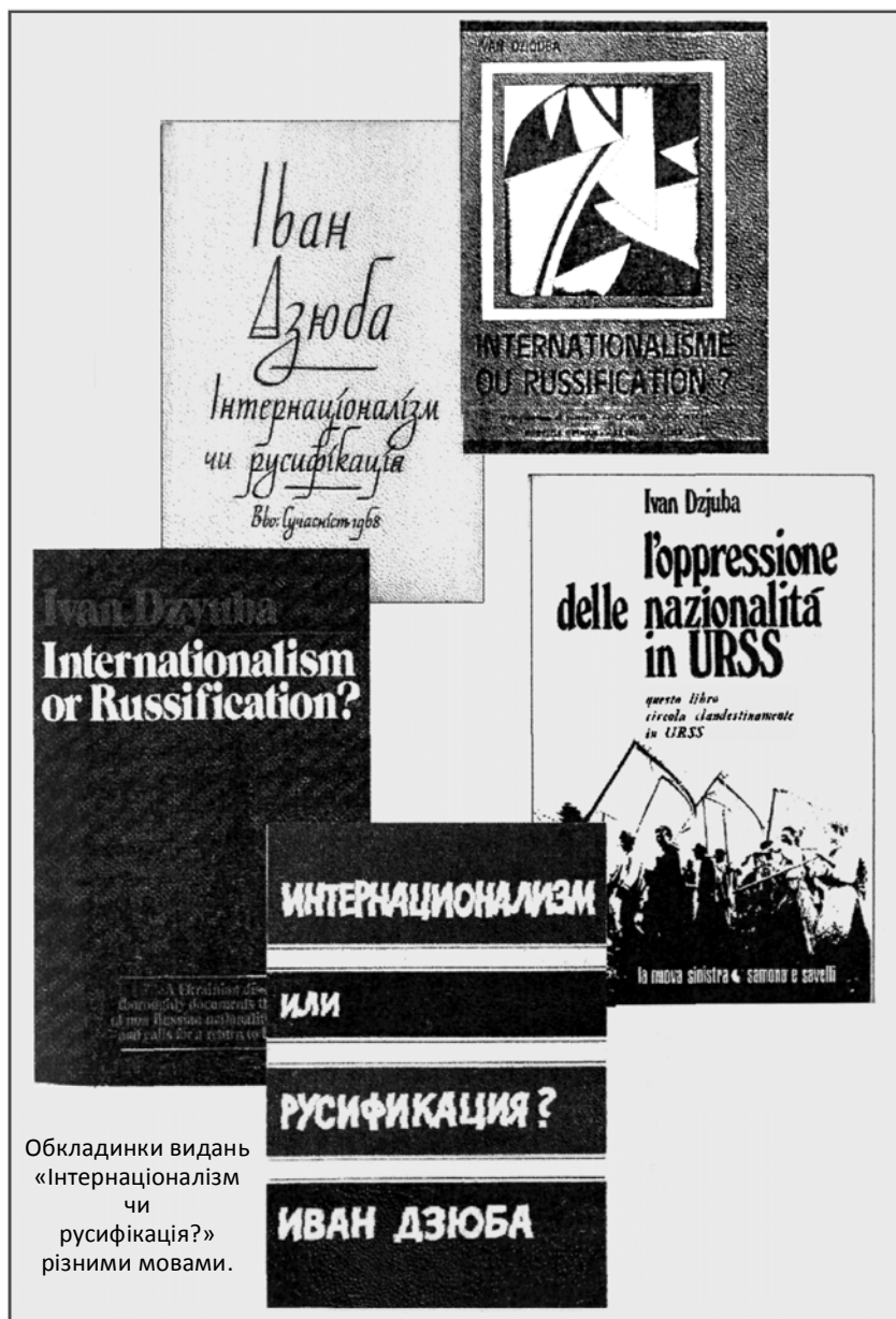
Обкладинки видань «Інтернаціоналізм чи русифікація?» різними мовами.