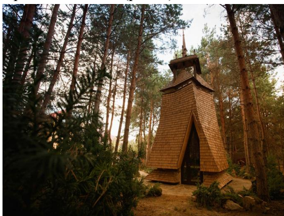
Рисунок 6. Покровська часовня, 2012, Вороньков, Україна, арх. студія RDSbrothers

Ярко демонстрирует отечественный опыт современного храмостроительства архитектурная студия RDSbrothers и их Покровская часовня, 2012, Вороньков, Украина (рис. 6). Также в качестве примера можно привести Храм Святого Евгения, 2007, село Буки, Киевская область, арх. Ю.И. Бабич (рис. 7).