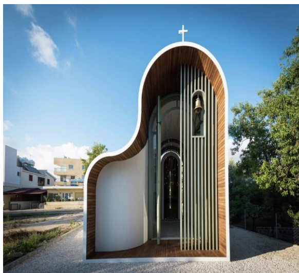
Рисунок 5. Часовня Апостола Петра и Святой мученицы Елены, 2015 год, Пафосе, Кипр, арх. Одиссей и Михалис Георгиу

Ярко демонстрирует отечественный опыт современного храмостроительства архитектурная студия RDSbrothers и их Покровская часовня, 2012, Вороньков, Украина (рис. 6). Также в качестве примера можно привести Храм Святого Евгения, 2007, село Буки, Киевская область, арх. Ю.И. Бабич (рис. 7).