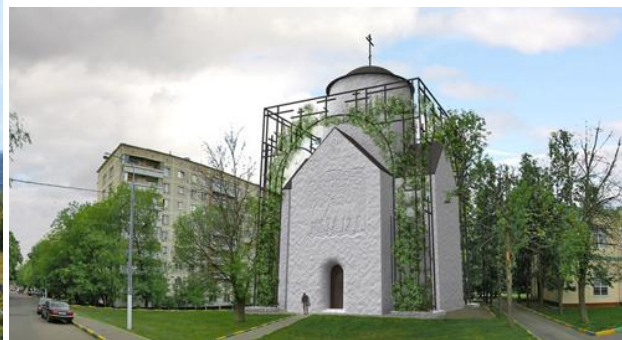
Рисунок 3. проект Скитський храм, арх. Д.Е. Макаров