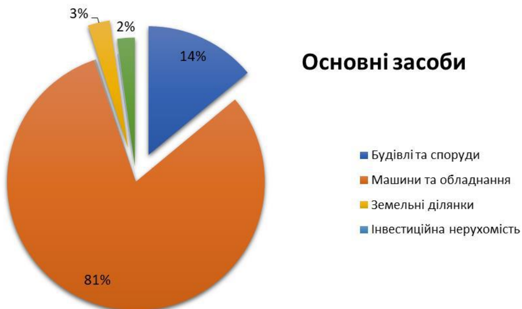
Рис. 2. Основні засоби виробничого та невиробничого призначення ПАТ «НКМЗ» за 2015- 2017 роки

Рациональне використання основних засобів та виробничих потужностей промислового підприємства сприяє покращенню всіх техніко-економічних показників, збільшенню виробництва продукції.