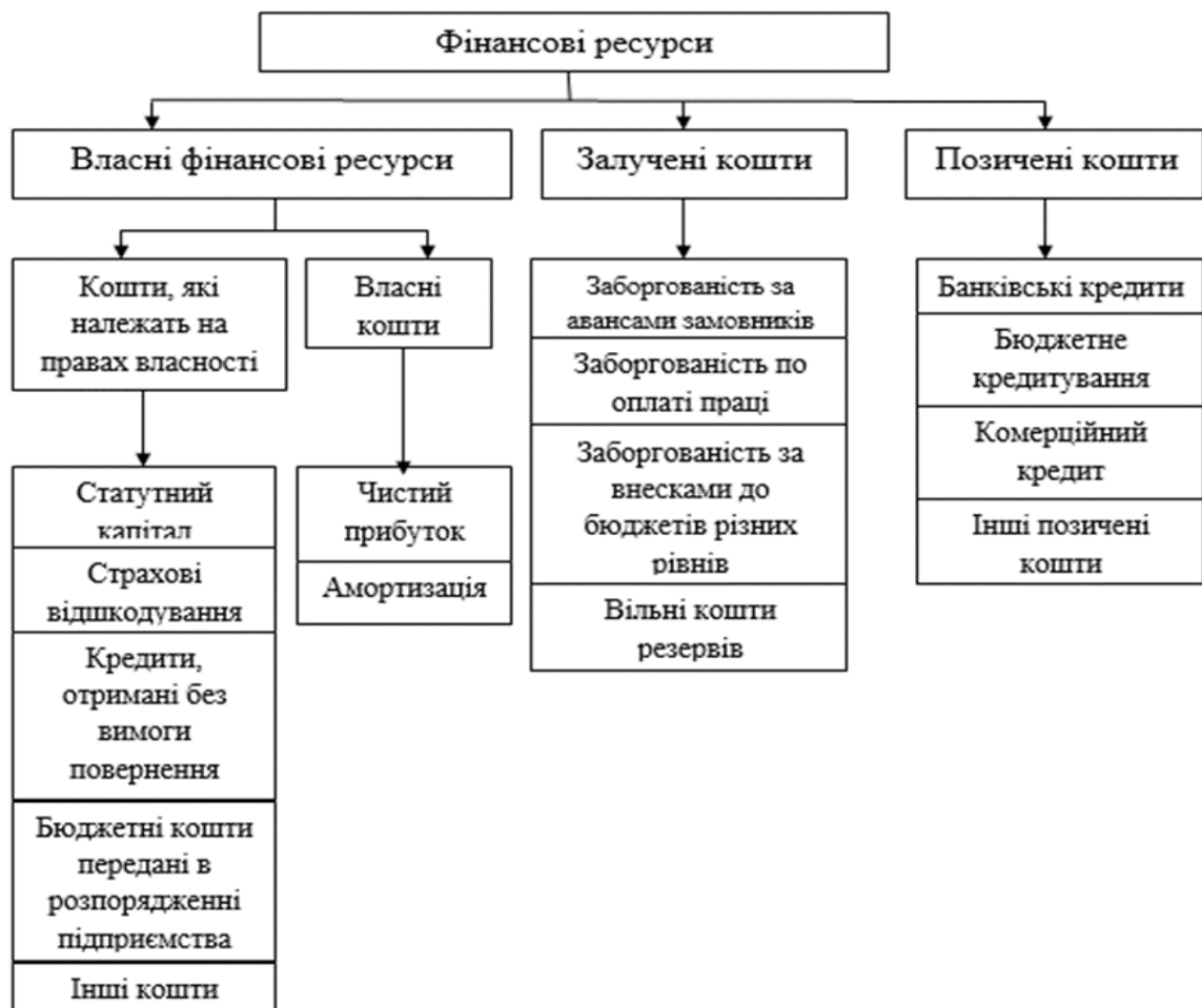
Рисунок 1 – Склад фінансових ресурсів підприємства [7]

Усі види перелічених джерел на рис. 1 беруть участь не тільки у формуванні активів підприємства, а й в здійсненні його виробничо-господарської діяльності з метою одержання відповідного доходу, прибутку [7].