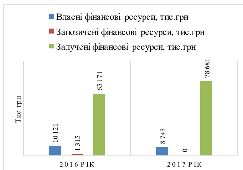
Рисунок 2 – Структура фінансових ресурсів за 2016-2017 рр., тис. грн.

Задовільний фінансовий стан підприємства: платоспроможність, фінансову стійкість, ліквідність і рентабельність визначають наявність достатнього обсягу фінансових ресурсів та їх ефективне використання. Виходячи з цього, найважливішим завданням підприємств є пошук резервів збільшення власних фінансових ресурсів і найкращого їх використання з метою підвищення ефективності роботи підприємства [2].