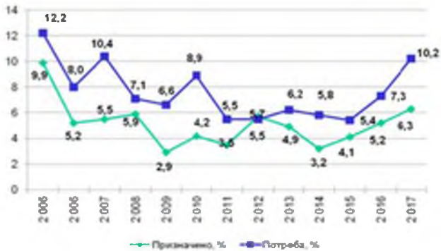
Рис.5. Результати ефективності виконання та фінансування планів підготовки ЗС України

Проведений аналіз показав, що рівень фактичного недофінансування потреб ЗС України, в середньому, складає 32,1%. Деякі роки потреби недофінансування заходів підготовки ЗС України досягали 40-50%. Це свідчить про недосконалість підходу щодо урахування впливів різних факторів на результати виконання планів підготовки ЗС України на стадії їх формування. Наслідком цього є достатньо значні показники коригування планів підготовки у ході їх виконання (в середньому 43,4% плану змінюється). Результати аналізу виконання та фінансування заходів бойової підготовки ЗС України в період 2005-2017рр. наведені на рис. 1 – 4.