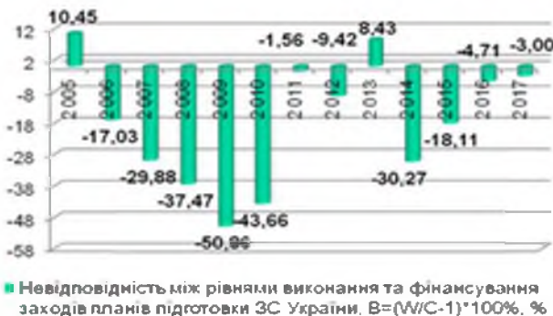
Рис.5. Результати ефективності виконання та фінансування планів підготовки ЗС України