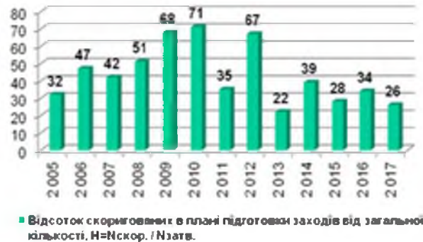
Рис. 4 Середні результати ефективності виконання та фінансування планів підготовки ЗС України за період 2005-2017рр.