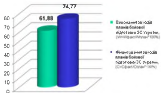
Рис. 4 Середні результати ефективності виконання та фінансування планів підготовки ЗС України за період 2005-2017рр.

Аналіз отриманих результатів показує, що існує достатньо значна розбіжність між цими показниками. В деякі роки вона складає понад 30-40%, що створює умови до не ефективного використання державних коштів. Значні розбіжності між плановими та фактичними результатами виконання та фінансування заходів планів підготовки ЗС України, що зумовлено недосконалістю підходів до перерозподілу коштів у разі невідповідності фінансових ресурсів запланованим потребам (в середньому за 13 років складають 12,9% в грошовому еквіваленті визначаються як приблизно 4,8 млрд. грн. неефективно витрачених державних коштів – це практично витрати за напрямом «Підготовка ЗС України» за 2-3 роки). Низька ефективність використання коштів, зумовлена неврахуванням пріоритетності та рівня навченості особового складу з'єднань (частин, підрозділів) під час розподілу коштів на заходи підготовки у разі невідповідності виділених ресурсів потребам щодо підготовки ЗС України.