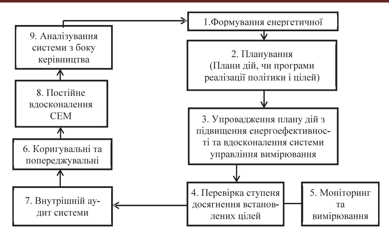
Рисунок 1 – Структурна схема побудована в рамках циклу Демінга системи енергетичного менеджменту